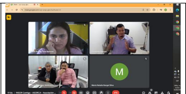
Asociación de sordos del Caquetá