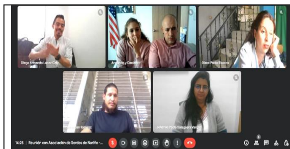
Asociación de sordos de Nariño.